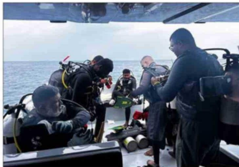
Este es el grupo de buzos rescatistas.

Este sábado falleció el experimentado buzo que lideraba las tareas de rescate de los exploradores.