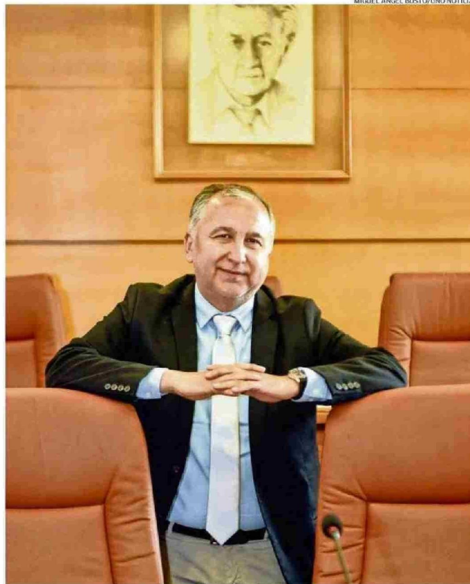
RECTOR DE LA UACH PROFUNDIZÓ EN LOS DESAFÍOS DE LA INSTITUCIÓN PARA MANTENER SU SOSTENIBILIDAD.

¿Por qué no se puede cumplir con ese pago?