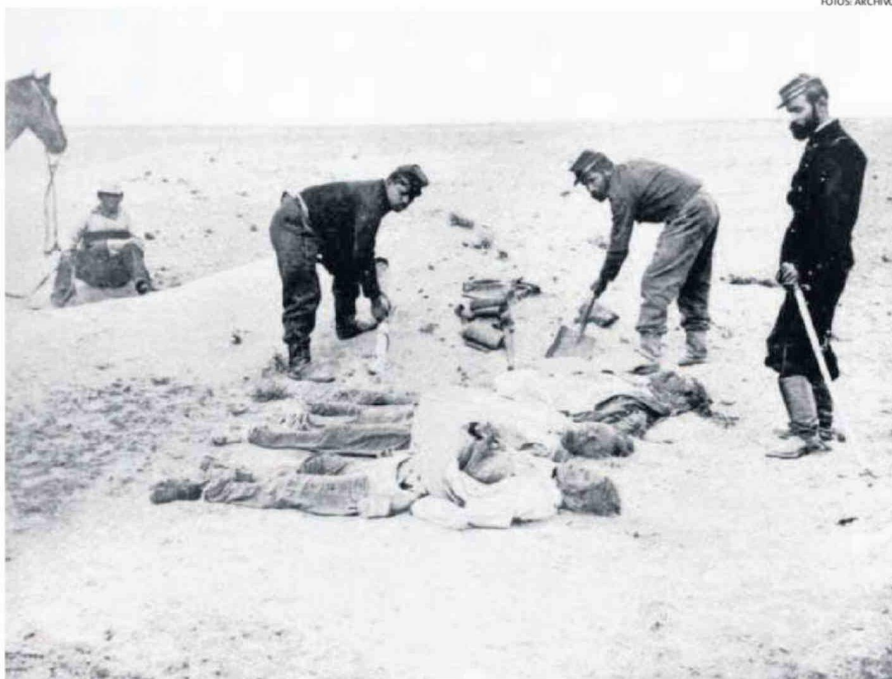
INFANTES CHILENOS SEPULTANDO A SOLDADOS ENEMIGOS CAÍDOS DURANTE LA BATALLA DEL ALTO DE LA ALIANZA, EN MAYO DE 1880.

Durante estas tratativas ocurrieron dos sucesos. Estos fueron el primer enfrentamiento armado entre los países beligerantes el 23 de marzo de 1879 en la localidad de Calama (combate de Topáter), y el descubrimiento por parte de diplomáticos chilenos que Perú tenía un tratado secreto de alianza con Bolivia en caso de guerra con Chile. Tras esto, el gobierno chileno bajo la administración del presidente Aníbal Pinto desestimó los esfuerzos de paz de Perú (gobernado por Mariano Ignacio Prado), conminando a renunciar a este tratado.