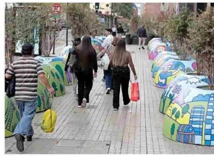
Afuera del mall Cenco Costanera instalaron grandes bolones de cemento para evitar que se ubiquen allí vendedores ambulantes.