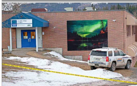
LA POLICÍA puso bajo resguardo la zona cerca de la escuela secundaria Tumbler Ridge, donde ocurrió el ataque.

Tiraje: 126.654 Lectoría: 320.543 Favorabilidad: No Definida