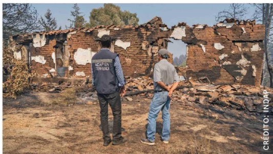
LA AUTORIDAD RECALCÓ LA importancia de completar la Ficha de Afectación Silvoagropecuaria (FAS) para traducir la afectación en ayudas directas.

Finalmente, la directora regional del Indap reconoció que se trata de un trabajo largo y extenuante, pero que necesario para contar con un mapeo completo de la afectación a nivel regional.