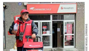
3.757 trabajadores Tenía correos al cierre del año pasado.

En la ley miscelánea que ingresó el gobierno anterior a fin de año —duramente cuestionada por los llamados “amarres”— se propina ampliar el giro de Correos de Chile, permitiéndole hacer labores de logística por medios físicos, digitales o híbridos. El 14 de enero esa norma fue rechazada.