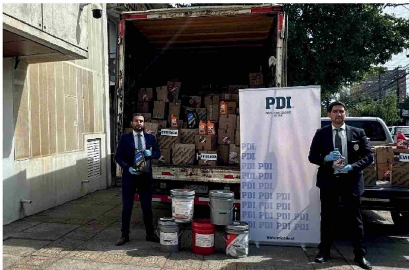
LAS ESPECIES RECUPERADAS fueron valuadas en 20 millones de pesos.

Si bien hasta ahora no se registran personas detenidas, desde la Policía de Investigaciones detallaron que las indagatorias continúan con el objetivo de identificar y detener tanto a los autores del robo como a los eventuales receptores de las especies sustraídas.