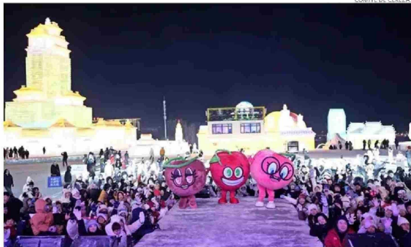
El Comité de Cerezas de Frutas de Chile apuesta a desarrollar el consumo del producto en ciudades del interior de China.