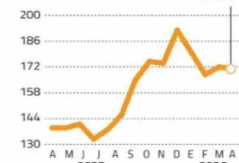
Acción Banco de Chile Precio en pesos