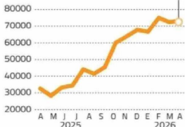
Acción SQM-B Precio en pesos