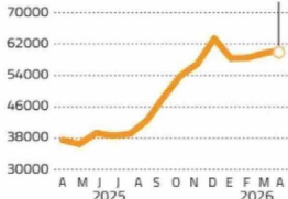
Acción BCI Precio en pesos