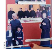
El Colegio San Agustín de Ñuñoa recordó su visita en una publicación.