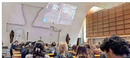
TRANSMISIÓN. — En la U. Católica se realizaron más de 30 horas de difusión del cónclave de cardenales en el Vaticano.

El obispo de Iquique, Isauro Covili, valoró la asunción de León XIV porque "ha trabajado en América Latina, en el Perú; conoce, ha sido pastor (...). Es un Papa, como manifestó en sus primeras palabras, para crear puentes y nos ha invitado al diálogo, a la paz, a comprometernos con la realidad, con el mundo; es un pastor para todos".