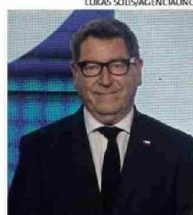
EL MINISTRO DANIEL MAS.