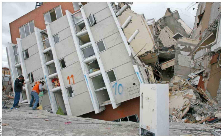
CONCEPCIÓN. Expertos toman muestras del material utilizado para construir el edificio Alto Río, el que se derrumbó en el terremoto de febrero de 2010.

La última disposición desarrollada en Chile fue publicada en 2009 y declarada obsoleta al no contemplar los movimientos e intensidades que se registraron durante el 27-F.