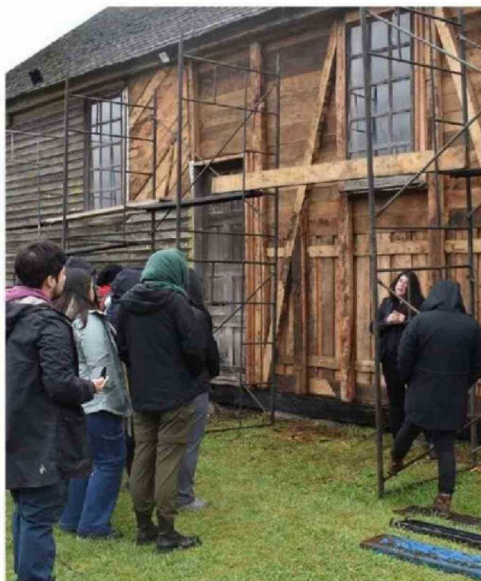
LAS RESTAURACIONES SE VERÍAN AFECTADAS CON LOS RECORTES.

pero también es momento de corregir, porque nuestro patrimonio no puede seguir cayéndose a pedazos”, enfatizó el chilote.