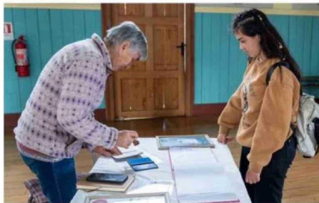
APERTURA TURÍSTICA DE LAS IGLESIAS CON EL USO DEL PASAPORTE SERÍA UNO DE LOS “DAMNIFICADOS” SIN LOS RECURSOS DE BASE.

Este programa, que cuenta con un presupuesto cercano a los $1.894 millones, también financia sitios Parque Rapa Nui, el Barrio Histórico de Valparaíso, las oficinas salitreras Humberstone y Santa Laura, Sewell,