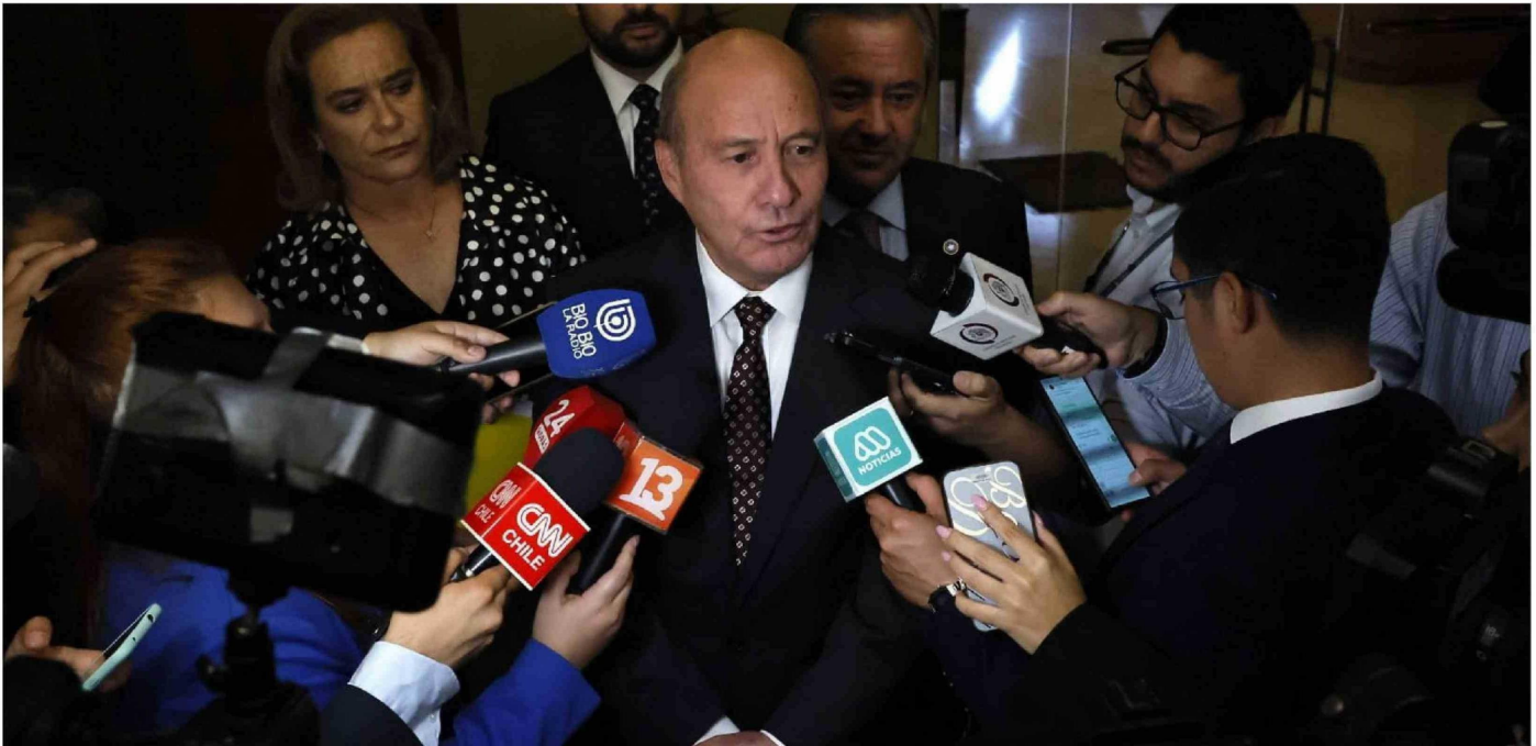
► Jorge Quiroz, ministro de Hacienda.