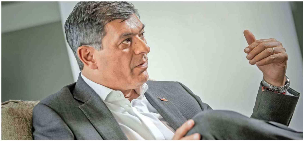
FRANCO PARISI Y EL APOYO DEL PDC A LA "LEY DE RECONSTRUCCIÓN":

“Al ministro Jorge Quiroz lo respeto intelectualmente, nos conocemos hace mucho” D 3