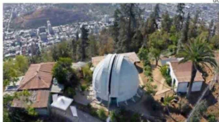
Es uno de los más antiguos del hemisferio sur.

Si la idea es conocer espacios que tal vez no concentren todas las visitas, mañana y el domingo abrirá de 11:00 a 17:00 el Observatorio Manuel Foster en Providencia. El equipo astronómico relatará la historia científica y patrimonial del primer observatorio astrofísico de Chile, declarado monumento nacional desde 2010.