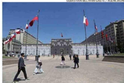
La Moneda es uno de los lugares más visitados.

Uno de los lugares que recibe mayor afluencia de visitantes es el Palacio de La Moneda, abierto este sábado y domingo con horarios desde 9:30 a 16:30 horas como último ingreso. Se podrá recorrer, entre otros, sus patios, los salones protocolares y la Galería de los Poetas. Además, habrán otras actividades como conocer la Casa de Moneda o la exhibición de adiestramiento canino.