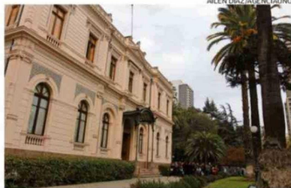
En sus jardines habrá una recreación de la Belle Époque.