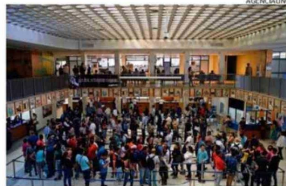
El archivo histórico en Huérfanos 1570 data desde 1885.