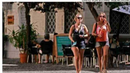
El histórico Barrio París-Londres espera visitantes.

La Asociación Gremial de Turismo y Comercio Histórico de Santiago indicó que diversos barrios abrirán sus locales el sábado y domingo. En el Barrio París-Londres, por ejemplo, destaca el restobar Londres 45, en Lastarria, Bar La Junta o Tren al Sur son opciones. También abrirán el Mercado Central, Barrio Brasil, Yungay y Bulnes.