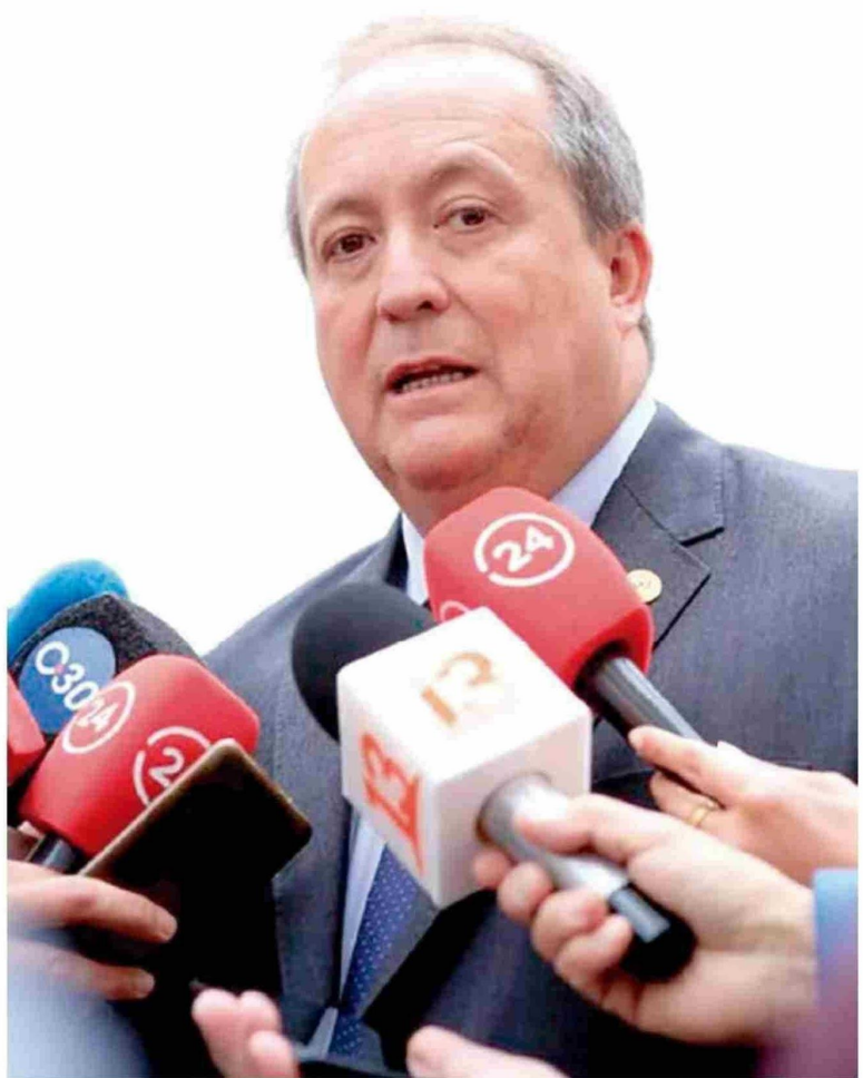
El fiscal nacional Ángel Valencia, anunció que se inició una investigación acuciosa para llegar al fondo del informe de Contraloría, en el que se ven involucrados 1.553 funcionarios.

diada transversalmente y puso en la discusión de la agenda pública las diferencias que en diversos ámbitos existen entre trabajadores públicos y privados. Una de ellas tiene que ver precisamente con las licencias médicas, puntualmente por ciertas facilidades que tienen en este ámbito los funcionarios del Estado, lo que -a ojos de expertos- funcionan como un incentivo para su uso fraudulento.