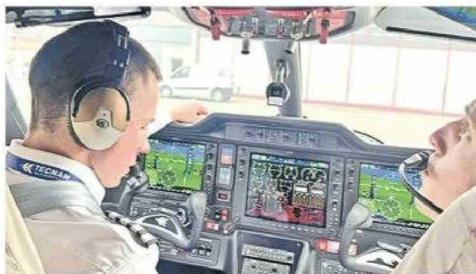
El Tecnam posee una aviónica muy avanzada y tecnología de punta.