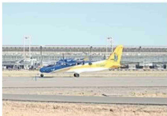
El Tecnam de Dap a su arribo al aeropuerto Arturo Merino Benítez de Santiago, tras 15 días de viaje.