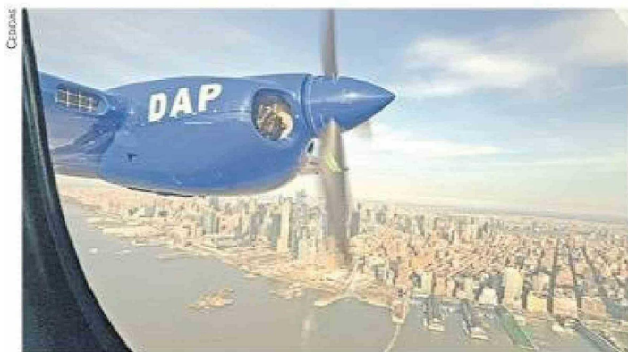
El paso del Tecnam por Nueva York, en su viaje a Chile.

Título: Dap apuesta por tecnología de punta con incorporación de nuevo avión Tecnam