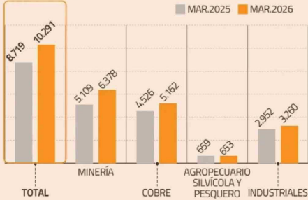
LOS ENVÍOS POR SECTOR US$ MILLONES FOB