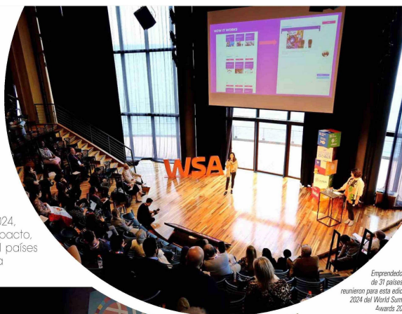
Emprendedores de 31 países se reunieron para esta edición 2024 del World Summit Awards 2024.

Para este 2024, el banco actualizó su oferta de valor, enfocándose aún más en el apoyo a startups y scaleups. Además, definieron metas desafiantes de captación de 1.500 nuevos emprendimientos emergentes junto con financiamiento vía deuda por MMU$350, enfocados en apoyar a emprendimientos que sean innovadores y escalables.