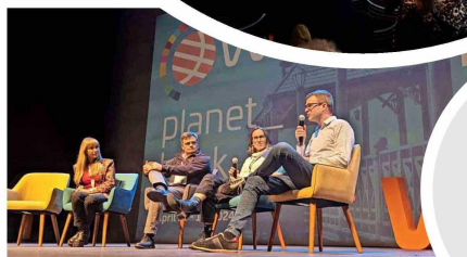
Representantes de Bci compartieron su visión sobre el apoyo al emprendimiento de alto impacto.