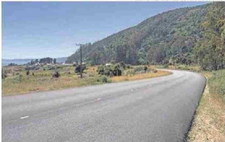
COMUNICACIONES GORE DE LOS RÍOS.