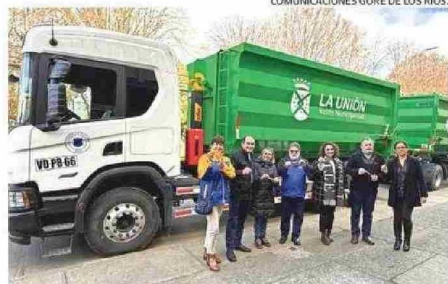
COMUNICACIONES GORE DE LOS RÍOS.

para nuestras comunas, desde las más urbanas hasta las más rurales. Nuestro rol es fiscalizar, pero también contribuir con propuestas y votos responsables cuando los proyectos van en la dirección correcta", agregó Schmeisser.