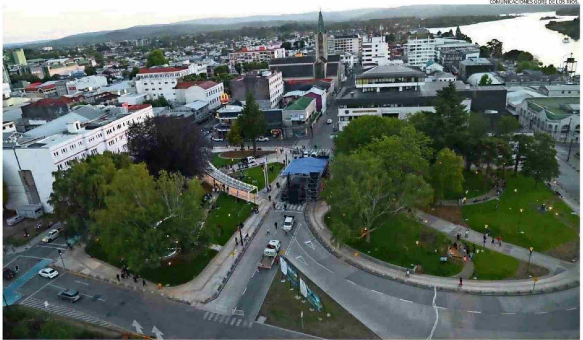
LA RECUPERACIÓN DE LAS PLAZAS CHILE Y PEDRO DE VALDIVIA, ES UNA DE LAS INICIATIVAS GENERADAS CON APOORTE FRIL. ABAJO, LA REPOSICIÓN DE LA ESCUELA FUSIONADA DE LOS LAGOS.

Tanto el gobernador Luis Cuvertino como los consejeros regionales, valoraron la inversión cuyo énfasis estuvo en la infraestructura pública, los municipios, la salud y la reactivación económica.