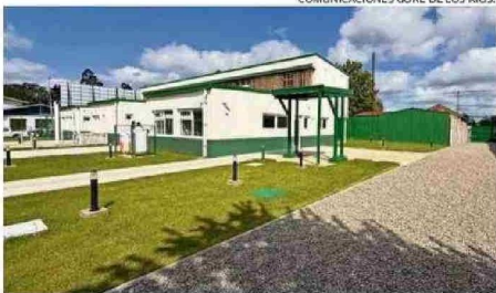
LA REPOSICIÓN DE LA TENENCIA DE CARABINEROS DE MARIQUINA.