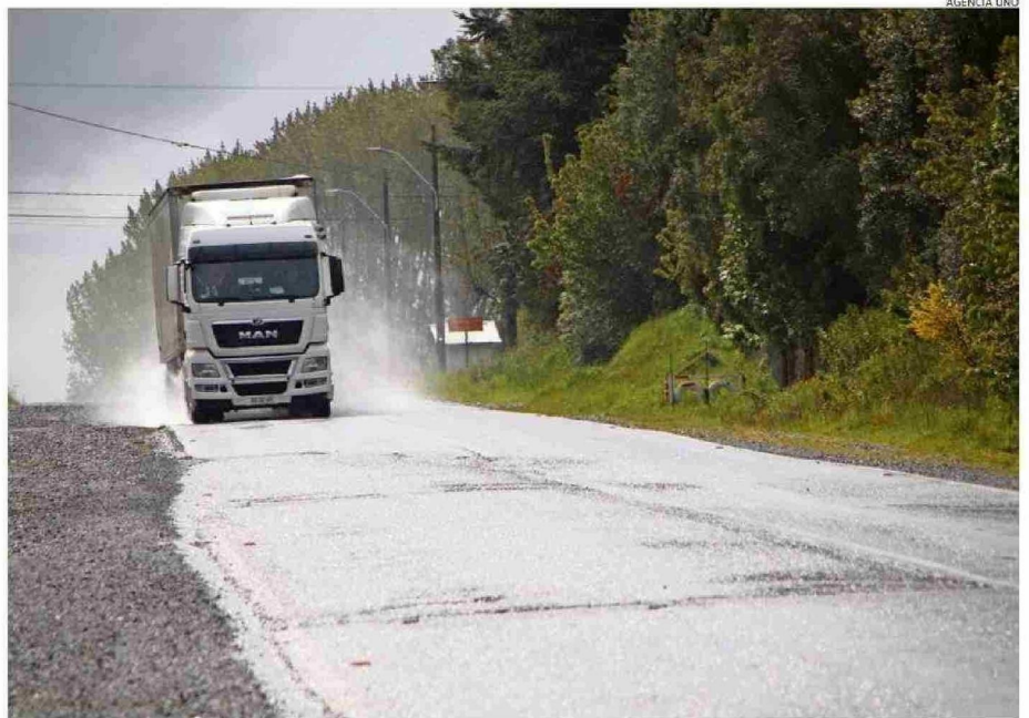
EL ESTADO DE LA VÍA 215 ES PAUPÉRRIMO: NO TIENE DEMARACIONES, BERMAS E ILUMINACIÓN. POR ELLA TRANSITA UN ALTO NÚMERO DE CAMIONES.

Si bien las zonas de completa oscuridad están en distintos puntos, al igual que la falta de paraderos, el tramo más complicado es de 20 kilómetros entre Las Lumas y Entre Lagos, que desde febrero del 2020 está abandonado, cuando la empresa Brotec dejó las obras. El proyecto de este segundo tramo consideró una inversión de $16.590 millones provenientes del Ministerio de Obras Públicas, que ya había concretado