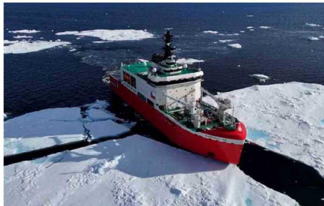
Rompehielos Óscar Viel en Antártica.

El manejo de nuevos sistemas de comunicaciones y radares más modernos se sumaba a la dificultad de operar en una meteorología impredecible. Sin embargo, con determinación y seguridad en su conocimiento, la Cabo Segundo logró superar el reto con éxito.