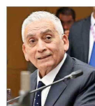
Su postulación fue ratificada de forma unánime por el Senado.