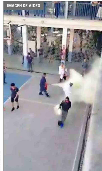
DISUASIÓN.— Un auxiliar del liceo accionó un extintor contra uno de los manifestantes.