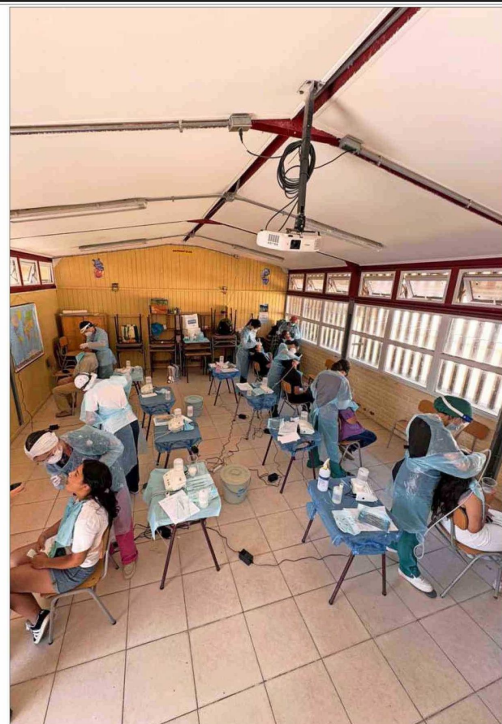
Alumnos de Odontología de la U. de Talca en trabajos voluntarios de verano. En unos días se realizará nuevamente uno que brindará atención dental a personas que lo requieren.

Asimismo, añade que su participación le ayudó a "desarrollar habilidades muy prácticas, como liderazgo de equipos, coordinación con do-