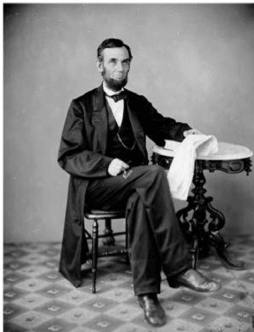
Abraham Lincoln consolidó la democracia en Estados Unidos aboliendo la esclavitud y defendiendo la unión nacional.