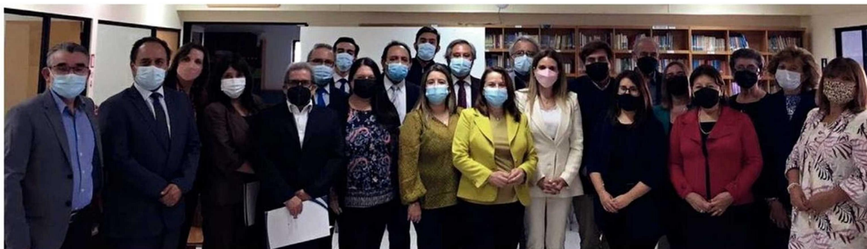
Directoras, Directores y Directivos de colegios miembros de FIDE Antofagasta que participan de forma activa de las actividades y el trabajo de la Federación.