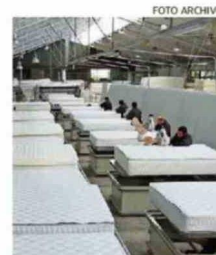
EL CRECIMIENTO SOSTENIDO HA IDO ACOMPAÑADO DE UN FUERTE DESARROLLO DE CAPITAL HUMANO.