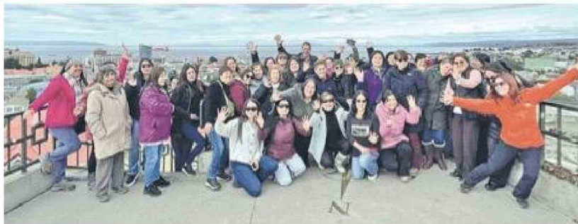
Un grupo de mujeres de Tucapel posa en el mirador del Cerro de la Cruz, en Punta Arenas, como parte del recorrido turístico que busca fortalecer el empoderamiento y la cohesión social.

Los viajes, que tienen una duración de cinco días, incluyen recorridos por Punta Arenas, Puerto Natales y el Parque Nacional Torres del Paine, donde incluso han logrado acceso gratuito gracias a gestiones con la Corporación Nacional Forestal (Conaf). En total, cerca de 650