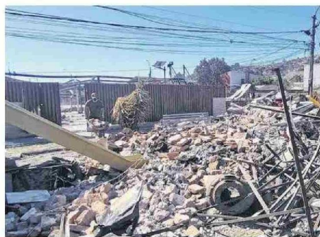
Las principales labores se concentran en el retiro de escombros.

"...todos queremos tener nuestras cosas, sabemos que nos va a costar, que probablemente se pueda demorar, pero no como ha sido en Viña o Santa Juana. Debemos canalizar la ayuda, porque si miras alrededor es como se veía cuando uno mira las noticias de lo que ocurre en Palestina, es como una bomba que arrasó con todo".