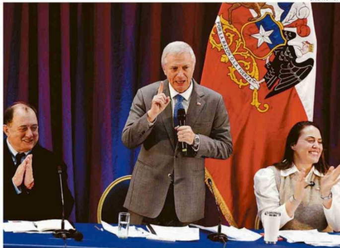
LOS MINISTROS PODUJE Y DUCÓ ACOMPAÑARON AL JEFE DE ESTADO EN EL DIÁLOGO CIUDADANO.

“Vamos a ir por los barrios más críticos; va a ha-