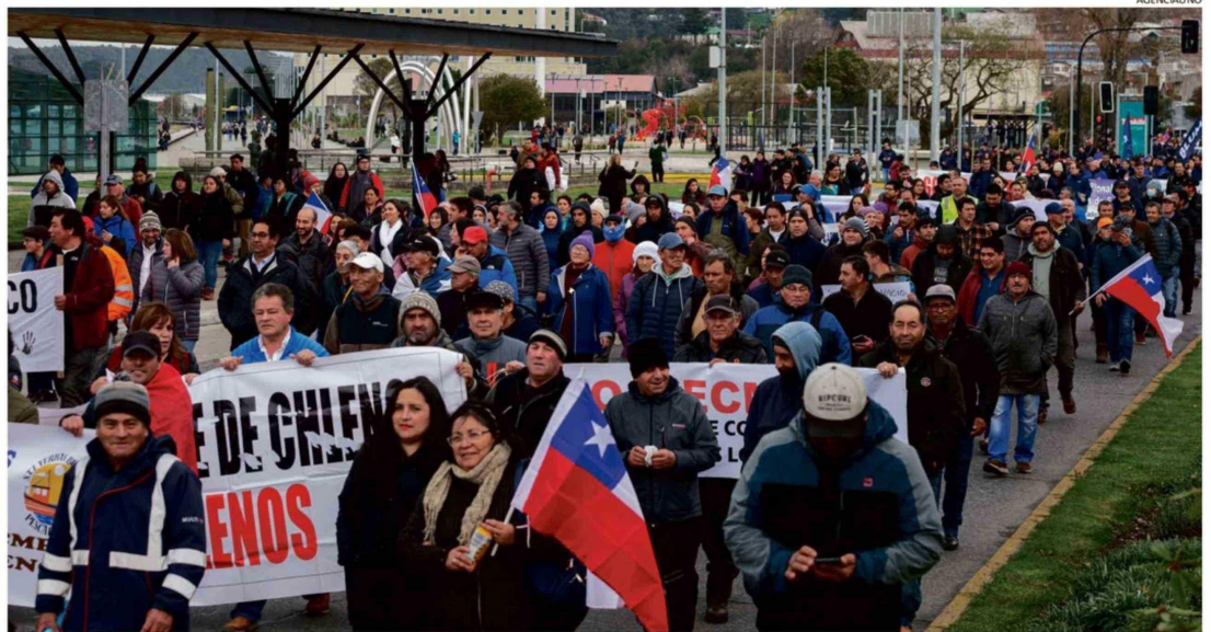
UNA MASIVA MANIFESTACIÓN CONTRA ESTA NORMATIVA SE REALIZÓ EN LA CAPITAL REGIONAL EN JUNIO DEL 2024.

En la misma línea, agregó que "incluso una obra como esta (el viaducto) po-