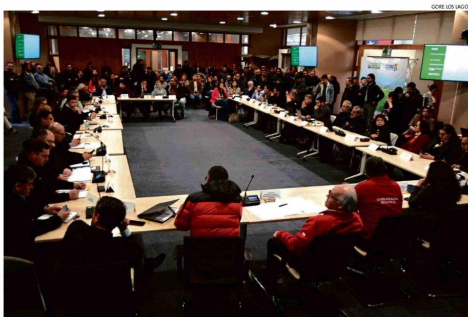
GORE LOS LAGOS