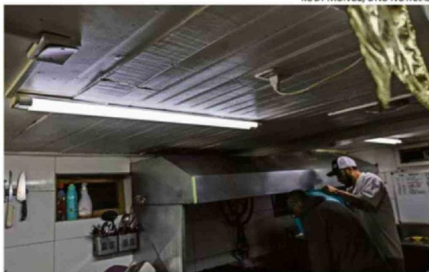
LA AUTORIDAD DICE QUE FALTA EL INFORME DEFINITIVO POR LA LUZ.

que son las que van a tener el mayor alza a nivel nacional", enfatizó.