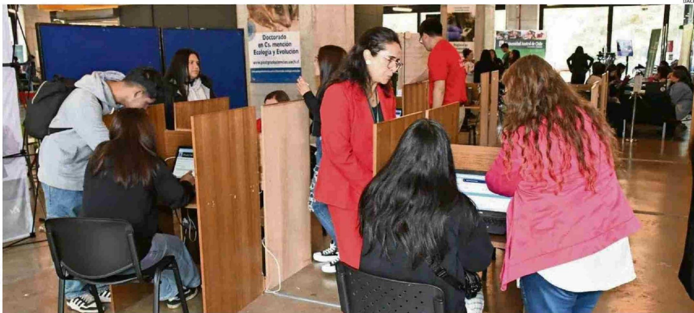
LA UNIVERSIDAD AUSTRAL DE CHILE HA DISPUESTO PUNTOS DE ATENCIÓN EN VALDIVIA, OSORNO, PUERTO MONTT, ANCUD (CHILÓE) Y COYHAIQUE.