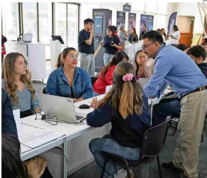
CERCA DE TREINTA STANDS CONFORMAN LA FERIA ORGANIZADA POR LA USS.

incrementó el puntaje promedio en Competencia Lectora en la región de Los Ríos con relación a la PAES anterior, representando un aumento del 2,4%.