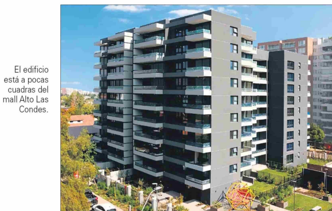
El edificio está a pocas cuadras del mall Alto Las Condes.

El departamento cuenta con un piso SPC (última generación de pisos vinílicos), ventanas de PVC y cubiertas porcelánicas.