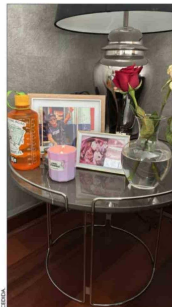
El lugar de su casa dedicado al comunicador.

sonas porque decían que era un símbolo súper potente en la llegada al aeropuerto. Para nosotros, el cariño de la gente ha sido algo maravilloso en esta pena de su partida. Ver cómo tantas personas se sintieron cercanas a él y conmovidas por su partida es algo extraordinario", reflexiona la abogada.