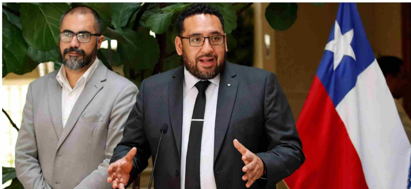
► Víctor Orellana, subsecretario de Educación Superior, y Nicolás Cataldo, ministro de Educación.

El Mineduc transparentó a los senadores de la Comisión de Educación los lineamientos de las indicaciones que pretende ingresar, los que buscan hacerse cargo de algunas de las severas críticas a la iniciativa. Sin embargo, diversos actores que han participado del debate aún no coinciden si es que son suficientes.