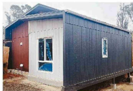
A LAS VIVIENDAS SOLO LE FALTAN DETALLES MENORES.

Desde Serviu Valparaíso confirmaron que las obras no continuaron debido a los problemas financieros de la empresa constructora, cuyo contrato contemplaba el término para junio de 2025. En agosto cesaron los trabajos y eventualmente el acuerdo de for-