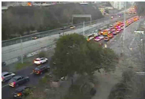
EL ACCIDENTE GENERÓ IMPORTANTE CONGESTIÓN VEHICULAR.

sencia de alcohol en la sangre y que este cooperó con la investigación policial.