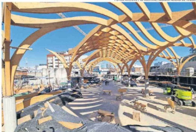
LAS OBRAS DE REPOSICIÓN SERÁN RETOMADAS, PROBABLEMENTE, EN PRIMAVERA.