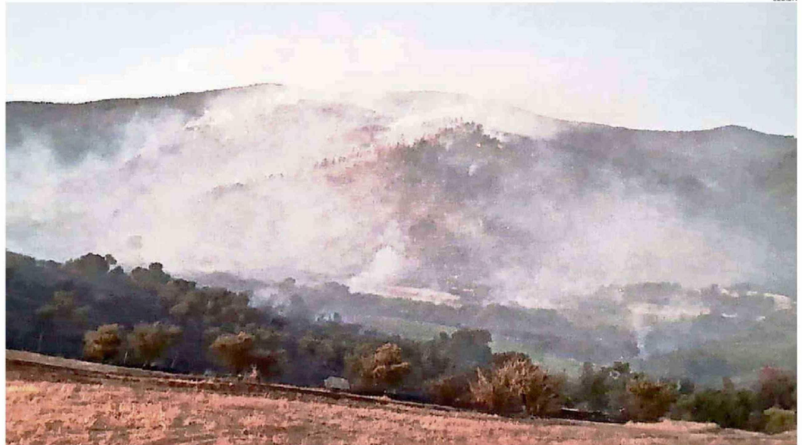
SECTOR DE AGUAS FRÍAS FUE PROTEGIDO POR EMERGENCIA EN NINHUE.