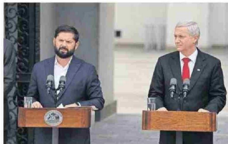
BORIC Y KAST DIERON UNA DECLARACIÓN CONJUNTA.

En esa línea, aprovechó de agradecer la "prudencia" y el espíritu de colaboración de Kast para evitar polémicas en mo-