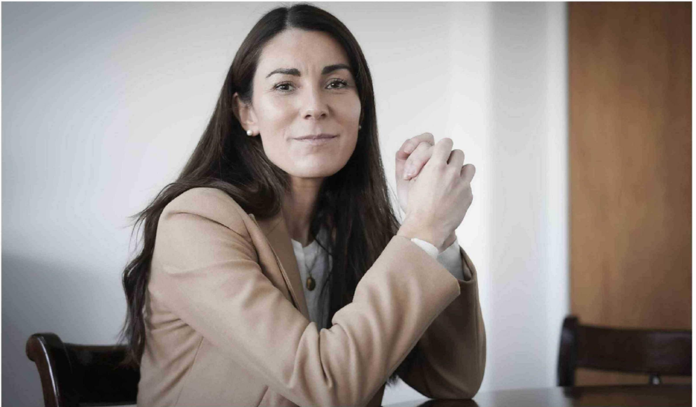
► La ministra de Educación, María Paz Arzola, defiende el proyecto de Escuelas Protegidas en los colegios.