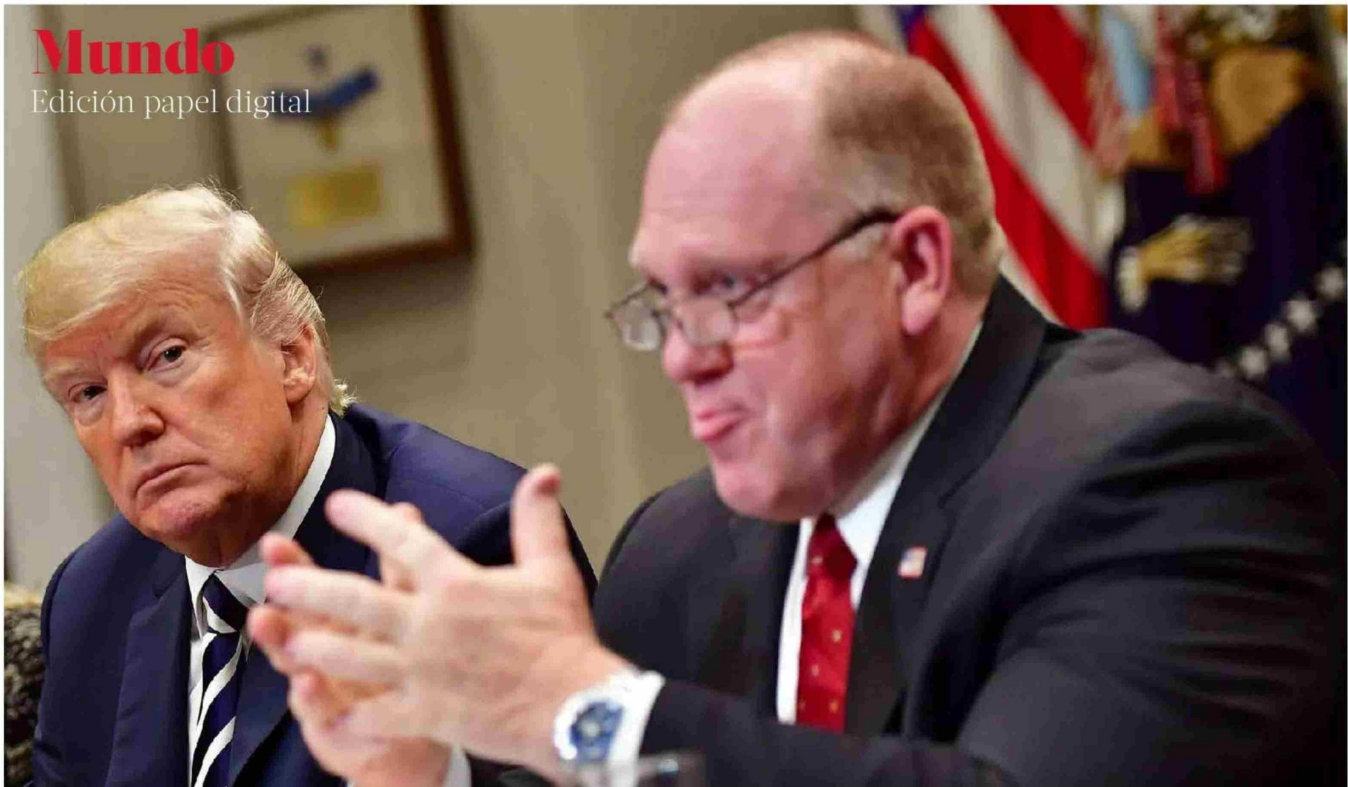
► Donald Trump y Tom Homan, entonces director interino del Servicio de Inmigración y Control de Aduanas (ICE), en la Casa Blanca en 2018.

Título: Trump retira a jefe de Patrulla Fronteriza de Minneapolis en medio de crecientes críticas a secretaria de Seguridad Nacional