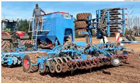
El alza del petróleo de los últimos meses encareció la siembra en el Fundo Tricauco.