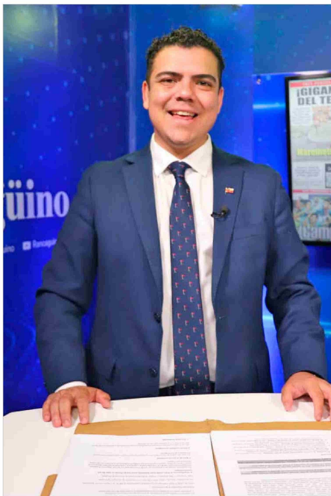
La autoridad regional destacó el trabajo intersectorial del gabinete en materias de seguridad, educación y apoyo social durante sus primeras semanas en funciones.