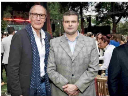
© Marcelo González y Giancarlo Maritano.