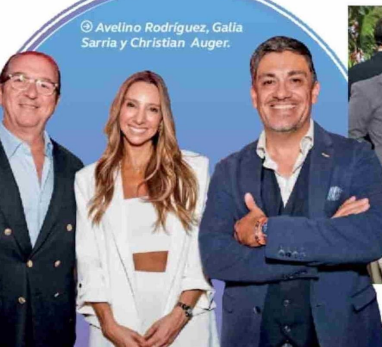
© Avelino Rodríguez, Galía Sarria y Christian Auger.