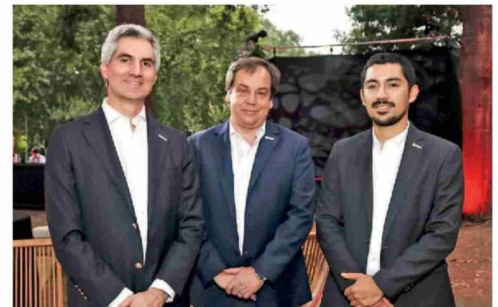
© Diego Mendoza, Daniel Nunes y Gustavo Hunter de ANAC.