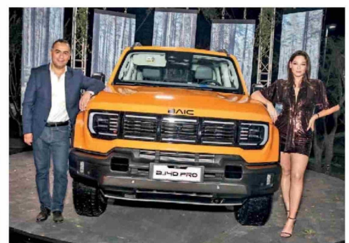
© Renato Rivas y Kel Calderón.