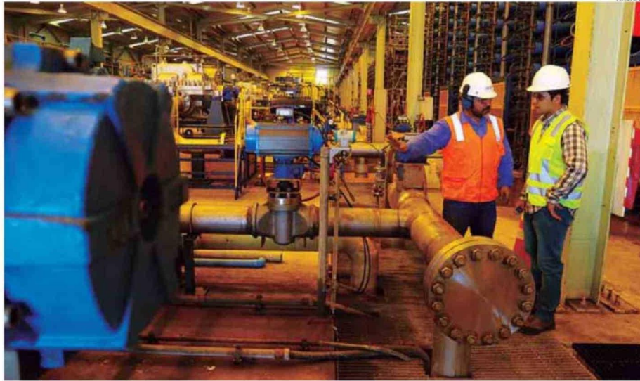
LA REGIÓN DE ANTOFAGASTA ES LÍDER EN DESALINIZACIÓN EN LATINOAMÉRICA, CON 13 PLANTAS OPERATIVAS.

"Actualmente Antofagasta es la región que lidera la capacidad de producción, con 6.985 litros por segundo (l/s). Sumando todos los proyectos, la región podría sumar 21.200 l/s".